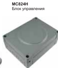
MC824H Блок управления