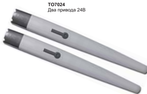
TO7024 Два привода 24В