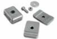
PLA13 Механические упоры крайних положений. 16,40 €