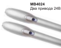
MB4024 Два привода 24В