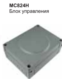
MC824H Блок управления