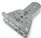
PLA14 Задний регулируемый кронштейн. 22,70 €